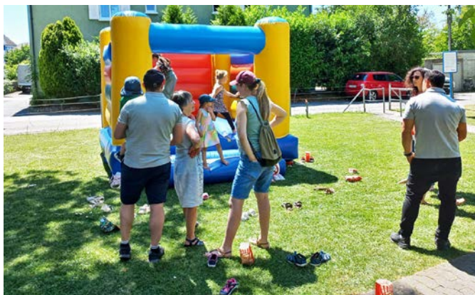
Für die Veranstalter: Rainer Böhm

Eröffnet wurde das Fest mit einem internationalen Buffet. Danach gab es unterschiedliche Kulturbeiträge, wie ein ukrainischer Frauenchor, der Kinderchor der Musikschule Goldach-Tübach und die Tanzgruppe Bomb Diggity aus Steinach. Im Anschluss daran verweilten die einen bei Kaffee und Dessert, die anderen folgten den unterschiedlichen Aktionen rund um die Kirche, wie Kaffeeceremonie, Spieleparcours, Hüpfburg, Basteln, Trommeln oder bei der Popcornmaschine. Zum Ende gab es noch eine Runde «Sing mit».